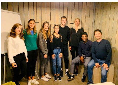
Spolupráce s Business Gate