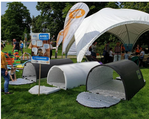
Účast na filmovém festivalu ve Zlíně