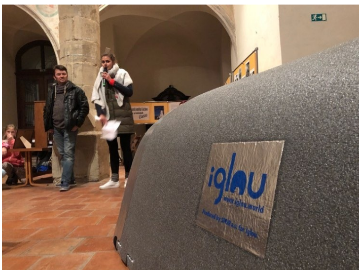
Účast na Noci Venku 2019